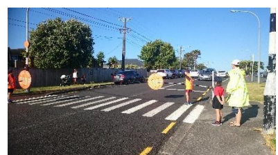
사인이 올려질때까지 기다립니다.