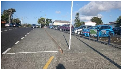
내려주고 타는 장소

만약 차로 등하교를 하면 아이들을 내려주고 태우는 구역 (drop-off zone) 이 Masterton Road 에 있습니다. 이곳은 차를 주차 할 수 없으면 단지 아이들을 내려주고 태우기 위해 짧은 시간 차를 세울 수 있는 곳 입니다. 학교에 등하교시 차를 타거나 걸어올때 만약 길을 건너야 할 경우가 생기면 반드시 횡단보도를 이용하셔야 합니다.