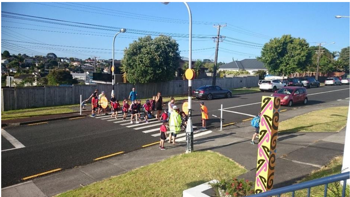
길을 건널때는 꼭 횡단보도를 이용합니다.